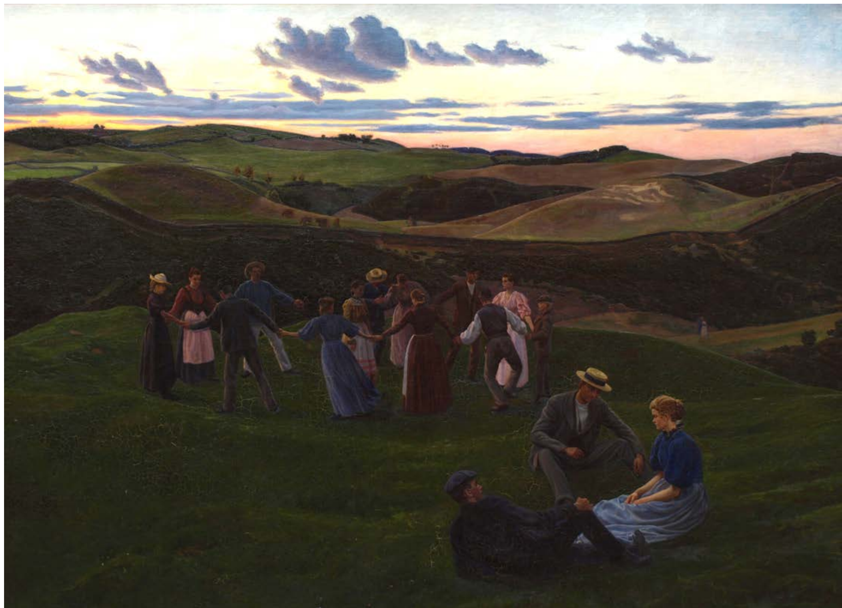
Fritz Syberg: Aftenleg i Svanninge Bakker. 1900. Olie på lærred. 174 x 230 cm. Faaborg Museum.

Det var her, hvor du står nu, at Fritz Syberg malede “Aftenleg i Svanninge Bakker” men stedet ser anderledes ud i dag.