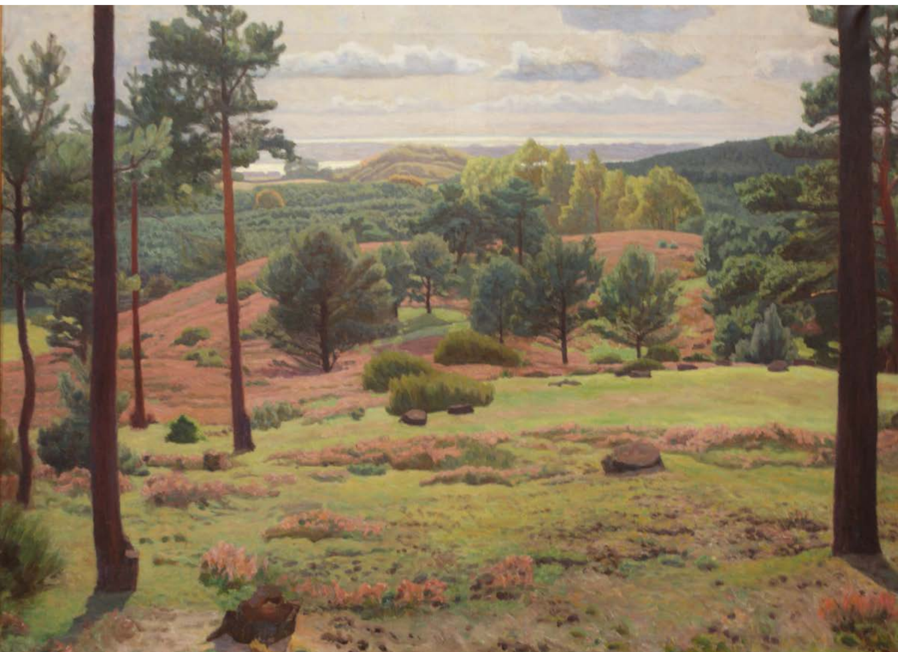
Jens Birkholm: Udsigt over Svanninge Bakker. 1912. Olie på lærred. 110 x 154 cm. Faaborg Museum.

Motivet er højst sandsynligt malet her på toppen af Lerbjergget med udsigt ud over Svanninge Bakker. Landskabet har ændret sig meget siden. Kan du genkende Helnæs i baggrunden? Jens Birkholm formår at skabe dybde og rum i værket ved at lade vores blik glide ned over bakkeformationerne, hvor vegetationen ændres, for til sidst at ende ved havets stabiliserende linje.